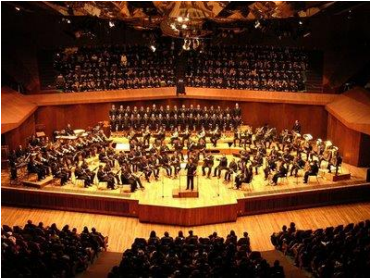
Sala Nezahualcóyotl, Ciudad Universitaria

A pesar de la apreciación de que gozaban entre los griegos las teorías metafísica y ética de la música , hubo también otros muchos que las criticaban. Incluso la interpretación fenomenológica provocaba objeciones, ya que presuponía que el «ethos» residía en la tonalidad misma, independientemente de la actitud del oyente, y atribuía a los sentidos un poder específico. Hubo también pensadores más prudentes que negaron a la música la posesión de estos poderes, sosteniendo que todas las propiedades atribuidas a la tonalidad -la solemnidad de la dórica, el estro inspirado de la frigia y la doliente tristeza de la lidia, no residían en su naturaleza, sino que habían sido creadas por el hombre en el curso de un largo proceso evolutivo.