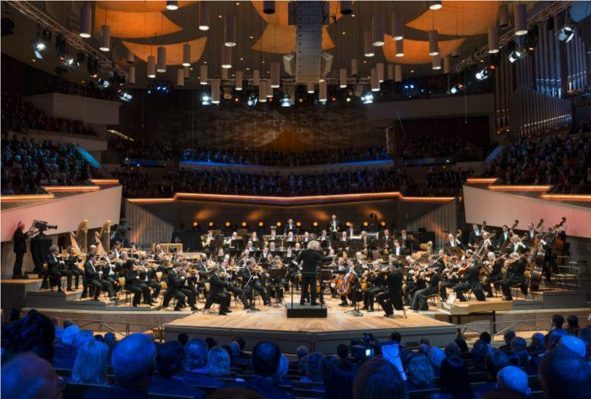
Orquesta Filarmónica de Berlín

independientes. Por un lado, surgió la música puramente instrumental y, por otro, la poesía destinada a ser leída y no, como antes, a ser cantada o recitada y escuchada. «El canto del poeta», quedaba sólo como una metáfora.