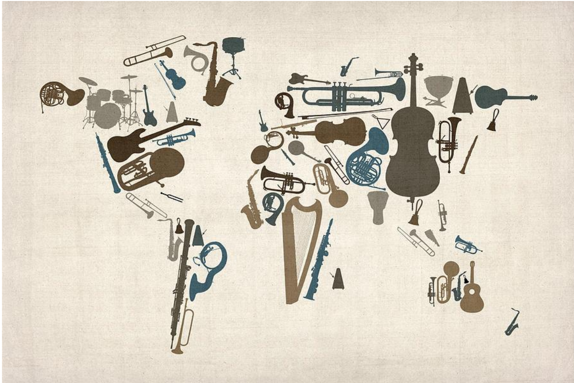
Tatarkiewicz, Wladyslaw . (1962). LA ESTÉTICA DE LAS ARTES PLÁSTICAS. En La Historia de la Estética (226-235). Polonia: AKAL.

impresiones sensoriales. Pero la de éstos era una concepción nueva y prometedora a la par que controvertible. Su crítica fue inevitable y la realizó Filodemo. El sentido común del epicúreo no coincidía con las sutiles distinciones de los estoicos. Así se ha dicho que la disputa entre estoicos y epicúreos sobre la interpretación racional del carácter de la música representó «la última gran polémica de la estética antigua».